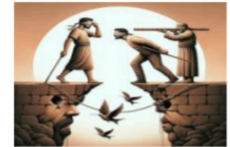
¿Pueden los ciegos guiar a los ciegos? Lucas 6:39-45

Declaración de la Misión de Presentación de Nuestra Señora Nosotros, la gente de la iglesia católica Presentación de Nuestra Señora, somos inspirados por el espíritu santo para vivir los mandamientos de Cristo mostrando amor a TODAS las personas, a través de los dones que Dios nos ha dado a cada uno de nosotros. Nos comprometemos con las virtudes de la fe, la esperanza y el amor adorando a Dios, en palabra y sacramento. Fortalecidos por Dios Padre, nos esforzamos por vivir el Evangelio al servicio de las necesidades de nuestra familia parroquial de fe y de la comunidad mundial.